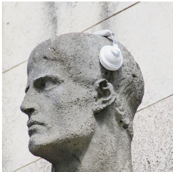
En Suisse, une personne sur six souffre de malaudition.

FORUM ÉCOUTE Fondée le 5 février 2002, la fondation romande des malentendants œuvre au service des personnes qui souffrent de déficience auditive.